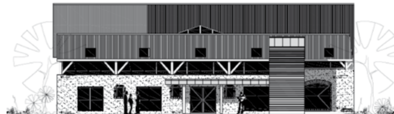
Façade Ouest projet