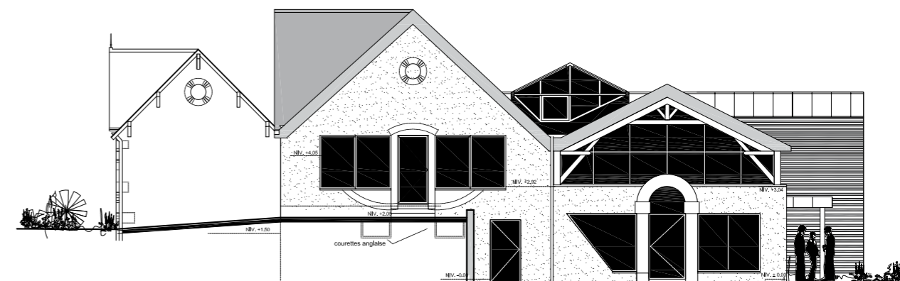
Façade Nord Sud projet