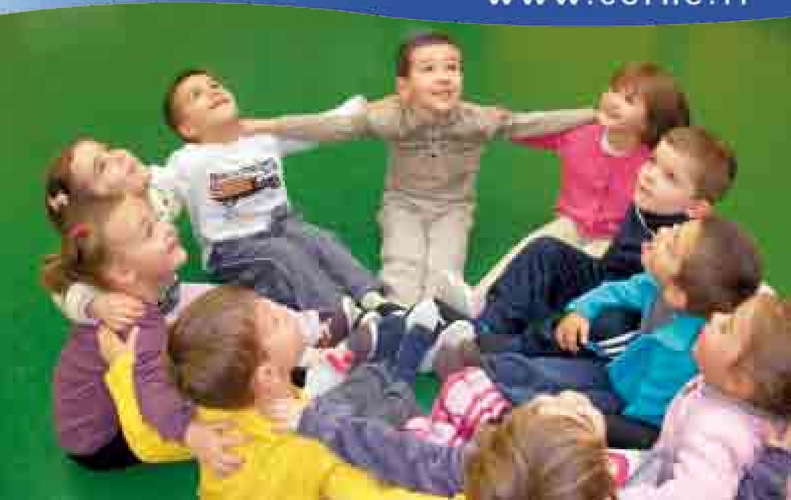
Cours de Baby Gym