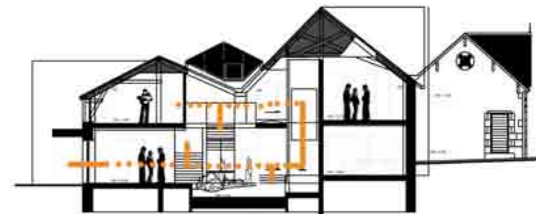
Coupe de principe

L'implantation de nouvelles fonctions implique des aménagements de circulations verticales au cœur de l'atrium mais aussi à l'extérieur du bâtiment. Cet état permettra de donner une nouvelle identité au bâtiment en marquant l'entrée se situant à l'ouest.