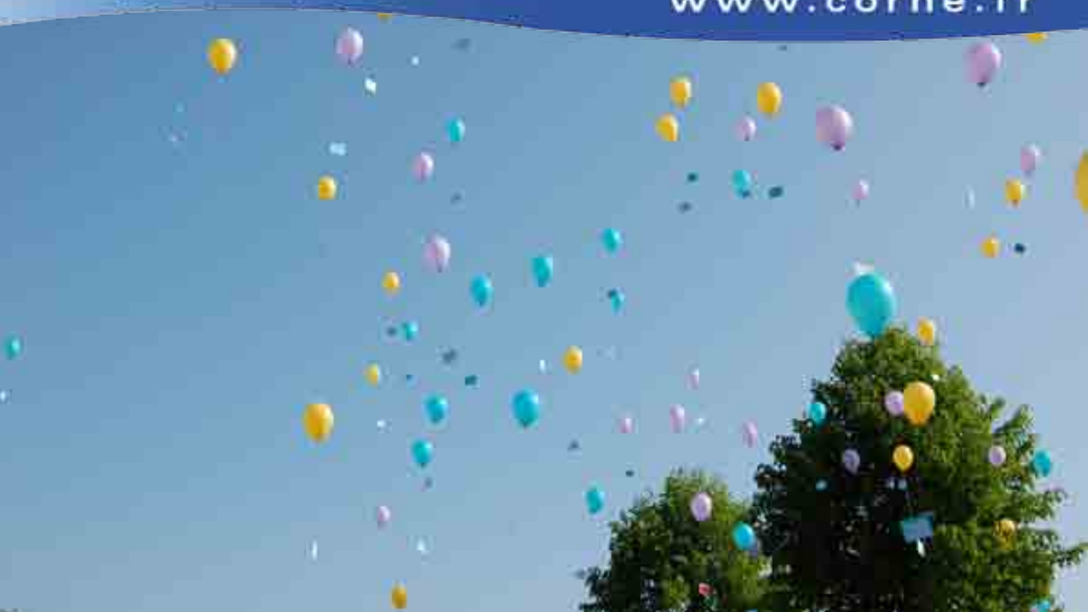
Lâcher de ballons à Corné