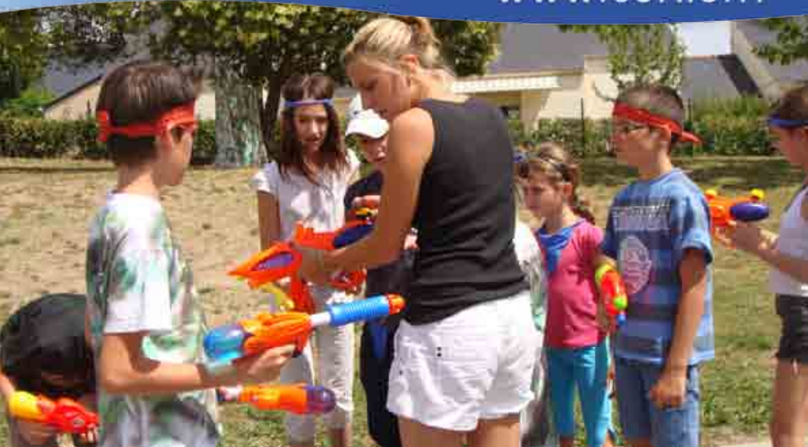
Accueil de loisirs - Paint aqua