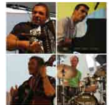
« Rehenes del tango », le quartet jazz de l'événement.

Tarifs enfant 5 € étudiant 10 € adulte 15 €